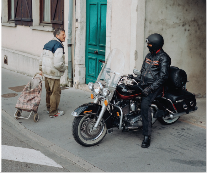
Görsel 2: Emgreen & Dragset tarafından küratörlüğü yapılan 15. İstanbul Bienali. grafik tasarım: Rupert Smyth.

Bienalde yer alan işlere tek tek değinmek sınırlı bir yazı alanında çok mümkün değil; fakat bienalde yer alan işlerin hepsine değinmek zaten gerekli de değil. Çünkü bienalin içerdiği işlerin kötü ve en kötü arasında bir ortalamaya sahip olduğunu rahatlıkla söylemek mümkün. "İyi Bir Komşu" teması, bu coğrafyanın komşuluk ilişkilerine dair vurgu yapılması açısından belki cazip görünmüştü: Ama bu "komşuluk ilişkileri nerede kaldı?" sorusunu da beraberinde getirir: Tüm bireysel ilişkilerin çıkar ilişkileri odaklı kurulduğu çürüyen bir toplum yapısında bundan bahsetmek ve bunun nostaljisini içeren işler üretmek ne kadar hedefe ulaşabilir? Öte yandan, birçok etnik topluluk ve ülke artık yakın komşu değiller, bazıları sınırların dışında komşular haline geldi. Öte yandan toplumsal ilişkiler de, kimlik siyasetinin günlük, geçici ve ideolojik olarak yanlış konumlandırılmış popülist-politik söylemleri içerisinde aşınmış durumda. Peki, bu politik düzlemde sanatın dilinin önerdiklerini nereye koyabiliriz?