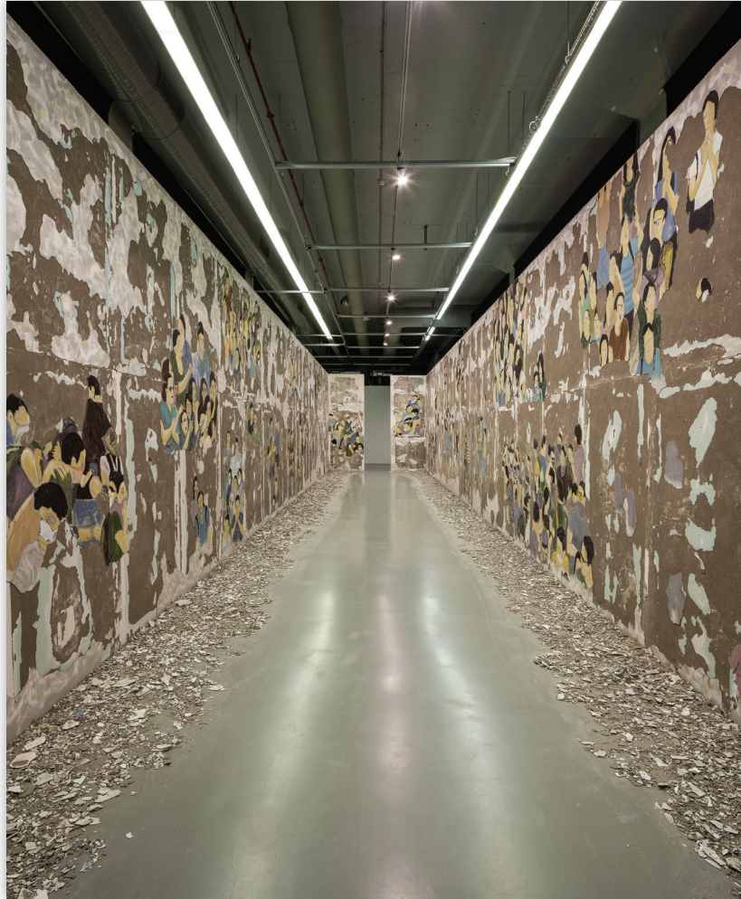
Görsel 3: Latifa Echakhch, Silinen Kalabalık , 2017

İstanbul Bienali, Türkiye'deki politika ve sanat sahnesinin, jeopolitik konularda kendisini nereye koyacağını bilemeyen iki arada bir deredeki konumunu, sanatın diliyle ironik ve mesafeli bir tutumla görünür kılmayı tercih etti. Küratörler Elmgreen & Dragset'in, daha çok günlük yaşamı ele alan ya da komşuluğu doğrudan bireysel deneyim üzerinden tarif eden sanatçıları ve yapıtları seçtikleri açık bir biçimde gözlemlenebiliyordu. Fakat bu tespit bizi, bienalde yer alan 56 sanatçının işlerinin, kamusal projelerin ve birçok yan etkinliğin bir politik dili olmadığı düşüncesine de götürmez. Pera Müzesi'nde çalışması yer alan Fred Wilson'ın, Osmanlı ve Türkiye tarihinde Siyah ve Afro-Türk kimlikler üzerine çalışması; Fas asıllı Fransız sanatçı Latifa Echakhch'in İstanbul Modern'de yer alan duvar resmi; ve Victor Leguy'un Fener bölgesinde yer alan bir mekân üzerinden mülteciler ve onların hikâyelerine dair nesnelere barındıran çalışması, politik bir duruşun her halükarda gösterilebileceğini ispatlama açısından önemli. Buna Sim Chi Yin'in göçmenlerin düşük ücretli olarak Pekin'de bodrum katlarında, penceresiz odalarda yaşamlarını gösteren fotoğraf serileri de eklenebilir. Peki, bunlar yeterli miydi?