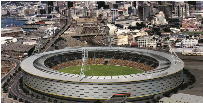
c) Wellington (Westpac Trust) Stadium [9]