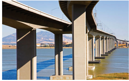
b) New Benicia Martinez Bridge [8]