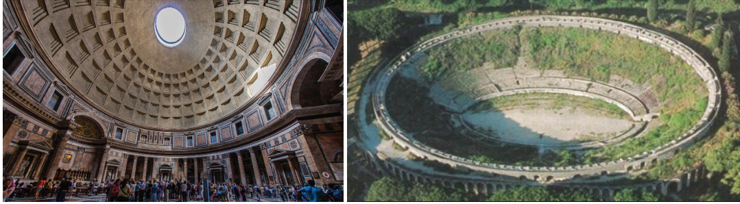
Şekil 1. Pantheon [1] ve Pompeii'deki amfityatro [2]

20.yüzyıla geldiğimizde; hafif agreganın betonda kullanımının, yük gemileri ile başladığı görülmektedir. N.K.Fougner'in tasarladığı 25 m boyunda ilk beton mavna, Norveç'de 1917'de denize indirilmiştir. Savaş koşullarında çelik yokluğu nedeni ile, A.B.D'de de ticari gemileri donatılı betondan üretme fikri benimsenmiş, Fougner ile 24 gemilik anlaşma yapılmıştır. I.Dünya savaşı devam ederken; J. Hayde, yaptığı araştırmalar sonucunda, 1918'de geliştirilmiş şist tipi hafif agreganın patentini almıştır. Bu gelişme, doğal hafif agregalara kıyasla istenen performans düzeyine daha kolay erişilebilen; üretimi, dane biçimi ve boyutu kontrol altında olan, daha yüksek dayanım elde edilebilen yapay agregayı uygulama alanına sokmak açısından önemli bir basamak olmuştur. 1917-1920 döneminde normal agregalı yapılarda beton dayanımı yalnız 17 MPa iken, üretilen donatılı beton gemilerde 1760 \text{ kg/m}^3 yoğunluk ile 38 MPa basınç dayanımı (Ries et.al., 2010) ve 23 GPa elastisite modülü elde edilmiştir 2 , 90 yıl sonra betondan alınan karotlarda dayanımın 60 MPa'a ulaştığı görülmüştür. Bu gemiler ile sadece kuru yük değil aynı zamanda petrol taşımacılığı da yapılmış, betona herhangi bir zararı izlenmemiştir (Fiorato, 1981). Ayrıca savaş döneminde, bir geminin kış tarafına isabet eden bombanın betonun kompakt iç yapısı nedeniyle kalıcı hasara neden olmadığı görülmüştür. Bazı gemilerden daha sonra dalgakıran olarak da yararlanılmıştır.