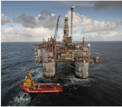
a) Heidrun Offshore Oil Platform (1996) [7]