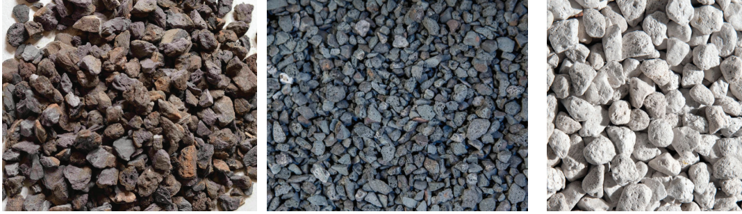
a) Genleştirilmiş şist [3]

ACI 213-03'e göre yapay hafif agrega olarak genleştirilmiş kil, cüruf, uçucu kül, şist, arduvaz ve doğal hafif agrega olarak bims (Şekil 2), taşıyıcı hafif beton uygulamalarında kullanılabilir. ASTM C 330'a göre taşıyıcı sistem hafif betonlarında kuru gevşek birim ağırlık, iri hafif agregalar için maks. 880 kg/m 3 , ince hafif agregalar için ise maks. 1120 kg/m 3 olmalıdır. İri agrega bazında gevşek birim ağırlıklar; genleştirilmiş kil için 700-1050 kg/m 3 ; genleştirilmiş cüruf, şist ve arduvaz için 800-950 kg/m 3 , doğal agrega olan bims için ise 400-800 kg/m 3 aralığı verilebilir. Maks. dane boyutu 10-12 mm, çökme değeri 15 cm olarak önerilmektedir (ACI 301-05), ancak çökmenin daha yüksek olduğu uygulamalar da mevcuttur. Kaliteli hafif agregalarda su emme genellikle %15'in altındadır (Neville & Brooks, 2010), genleştirilmiş şist ve arduvaz tipi yapay hafif agregalarda bu oran %10'un altındadır. Türkiye'deki doğal bims iri agregalarında ise, genellikle -24 saat bazında- su emme % 15'in üzerindedir, bu da yüksek basınç dayanımı elde etmeyi zorlaştıran bir unsurdur.