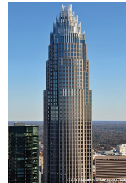
d) Bank of America Corporate Center [10]