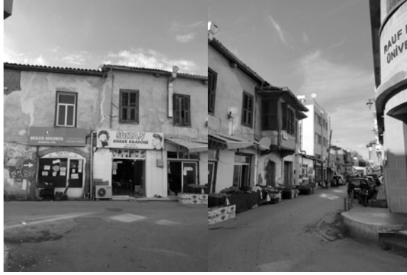
Şekil 3-4: Üniversites binası.