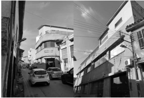
Şekil 5-6. Üniversitenin yer aldığı sokak.