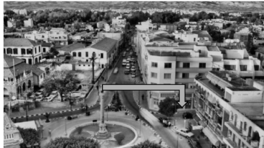
Şekil 2. Üniversite binasının bulunduğu, meydana çıkan sokak.