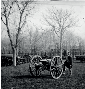
Fotoğraf 21. ABD Arsenal'inde silahlı birlik askeri, Washington DC, 1862

Amerikan İç Savaşı, 1861 yılında başlayarak ülkeyi sarsan büyük bir çatışma olarak tarihe geçmiştir. Tarih boyunca savaşların sebep olduğu acılar, kayıplar ve yıkımlar insanların zihninde derin izler bırakmıştır. Ancak savaşın gerçek yüzünün nasıl kaydedildiği ve gösterildiği, bu trajik olayların anlaşılmasında ve tarih boyunca savaşın nasıl algılandığını anlamamızda önemli bir rol oynamıştır. Bu önemli dönemde savaşın görsel bir şahidi olarak öne çıkan isimlerden biri de Mathew Brady'dir. Amerika Birleşik Devletleri Başkanı Abraham Lincoln, savaşın gerçek yüzünü insanlara göstermek amacıyla fotoğrafçı Mathew Brady ve ekibine çalışma izni vermiştir. Susan Sontag'ın (2004) belirttiği gibi, fotoğrafın temel görevlerinden biri "kaydetmektir". Kırım Savaşının tersine bu savaşın yıkıcı etkileri saklanmamış, kaydedilen görüntülerle savaşın gerçek yüzünün görülmesi sağlanmıştır. Brady'nin çalışmaları, savaşın gerçeklerinin anlatımında fotoğrafın güçlü bir araç olduğunu ve savaşın tanığı olarak nasıl kullanılabileceğini gösteren önemli bir örnektir.