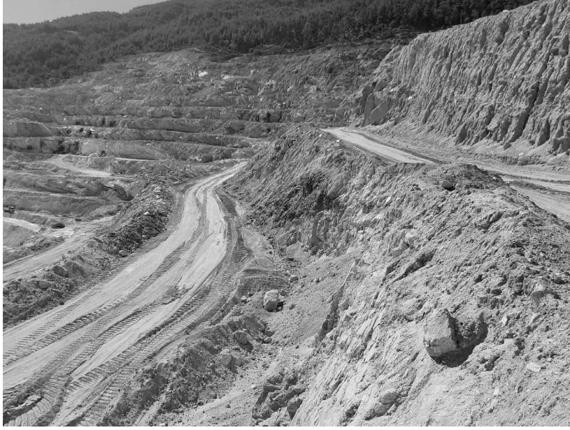
Şekil 3. Hatıpkışla köyü (Aydın) çevresinde bulunan bir feldspat/albit maden ocağının görünümü

Çine ilçesi ilk sıradadır. Bu bölgeleri Bilecik ili, Söğüt ilçesi izlemektedir. Türkiye’de yürürlükte olan feldspat işletme izinli ruhsat sayısı 2021 yılı sonu itibarıyla 194’dür. Ruhsat sayısı bakımından ilk üç sırayı sırasıyla, 67 ruhsat ve %34 oranı ile Aydın (Çine: 46), 47 ruhsat ve %24 oranı ile Muğla (Milas:35), 22 ruhsat ve %11 oranı ile Bilecik (Söğüt:13) almaktadır (MAPEG, 2022b). Madencilik faaliyetlerinin yoğunlaştığı bölgeler (Çine, Milas, Söğüt) ve veriler (ruhsat sayıları) dikkate alındığında, feldspat mineralleri açısından rezerv alanları ile madencilik alanlarının benzerlik gösterdiği görülmektedir.