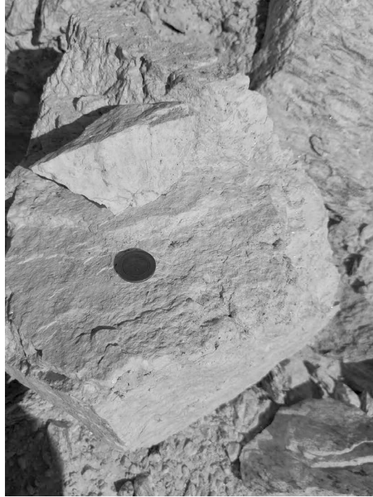
Şekil 2. Plajiyoklaz alt grubu feldspat mineralinin el örneğinin yakın plandan görünümü (Aydın)